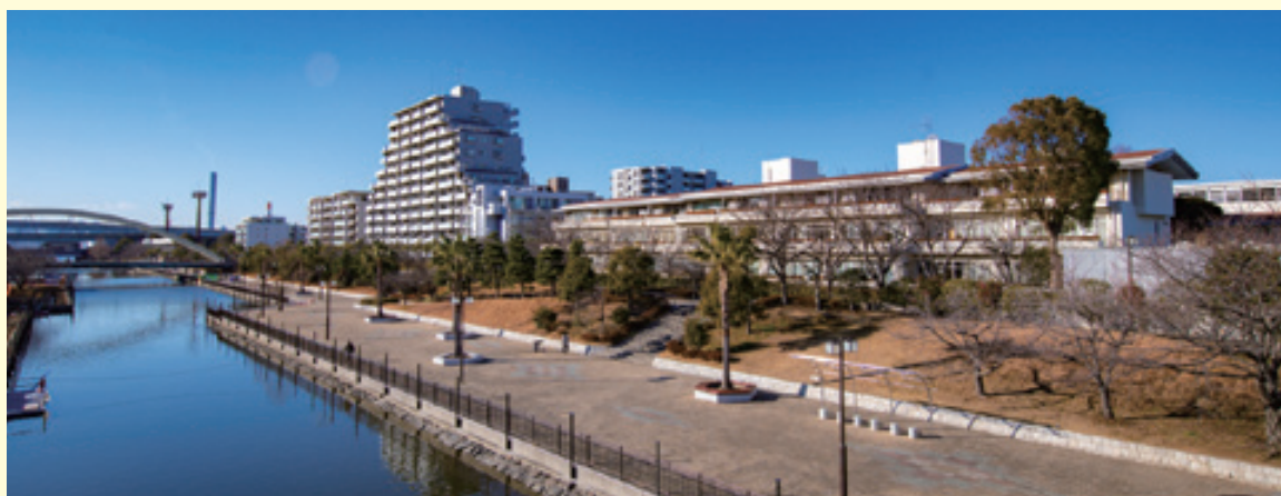
新左近川親水公園に面した閑静な環境のキャンパス