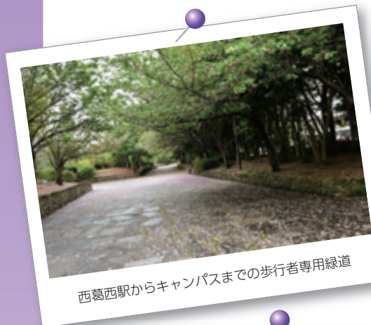
西葛西駅からキャンパスまでの歩行者専用緑道