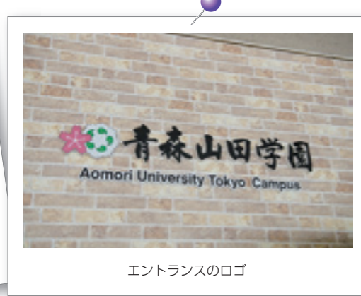
エントランスのロゴ