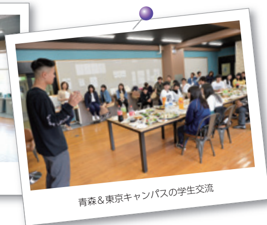
青森&東京キャンパスの学生交流