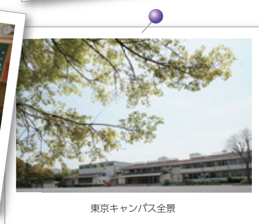
東京キャンパス全景

最寄り駅からのアクセスは、東京メトロ東西線「西葛西」駅南口より徒歩約15分、JR京葉線「葛西臨海公園」駅より徒歩約20分です。西葛西駅エリアは飲食店、商店、銀行などが充実しています。またレンタサイクルも発達しています。