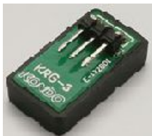
今回使用予定のジャイロセンサ KRG-3 の外形